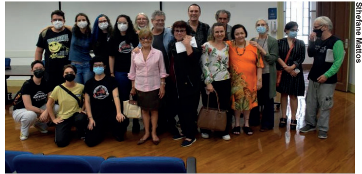
Profesores comemoram na sala P-65 o resultado do Consad.

Também destacamos as mensagens de felicitações de docentes, coletivos e da comunidade em geral comemorando esta importante conquista.