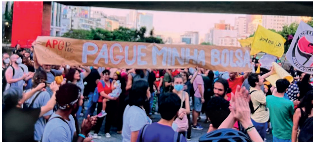
Presença da APG-PUCSP na manifestação dos Pós-Graduandos

Os pós-graduandos de São Paulo organizaram na quinta-feira, 08/12 uma manifestação na Avenida Paulista. Sob o título Paguem minha bolsa os estudantes protestaram contra o ataque do governo Bolsonaro que não irá garantir o pa-